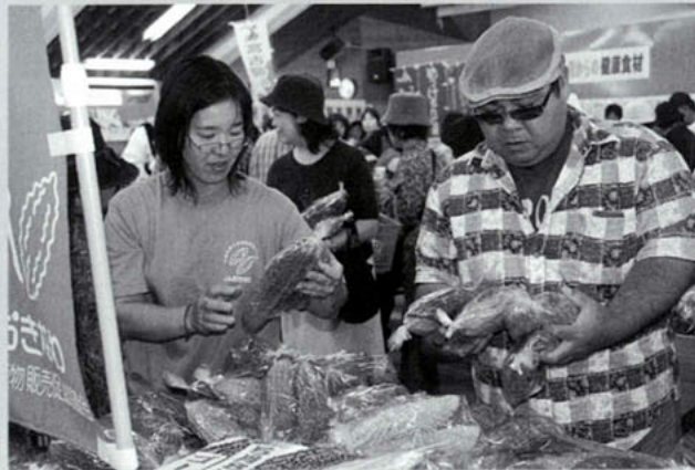
大人気のゴーヤー1袋58円コーナー

「宮古島のヘルシー野菜ゴーヤーでパワーアップ」をテーマに、「ゴーヤーの日」の5月8日、JAあたらす市場でゴーヤーの消費拡大キャンペーンが開催されました。(主催:「ゴーヤーの日」実行委員会)