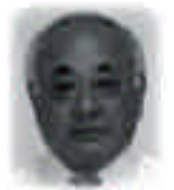
市長からのメッセージ

宮古島市では、行政と保護者及び市民が一体となって、本市の宝である児童を心身ともにたくましく育成するように務めるため、5月5日から始まる児童福祉週間の行事の一環として、絵画作品の展示・鯉のぼりを掲揚して、健全育成活動の一層の普及と向上を図ります。