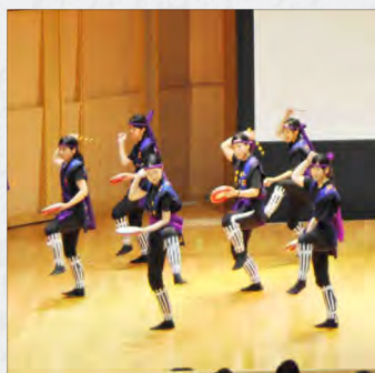
美作大学沖縄県人会のエイサー