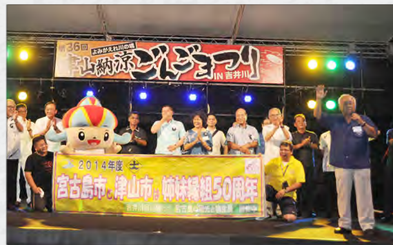
ごんごまつりステージにて宮古島PR