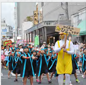
笑顔で踊る子ども達！