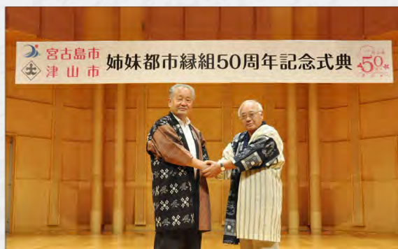
100周年に向け宮地津山市長とガッチリ握手