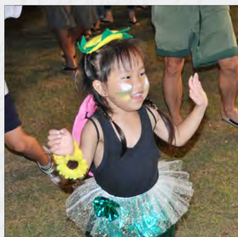
キュートなごんご (カッパ)