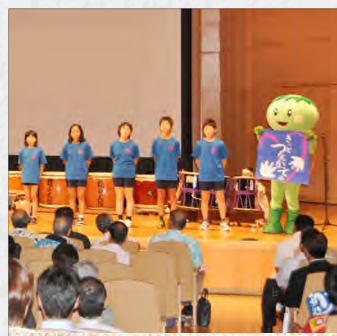
津山市南小児童の未来宣言