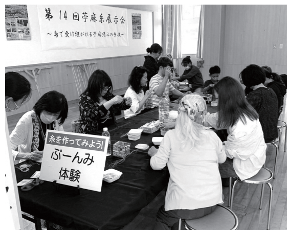
▲芋麻糸展示会でのぶーんみ体験

芋麻系は、宮古上布の糸であり、その糸を製作する手績みの技術は、国の選定保存技術に選定されています。芋麻系は、芋麻（ブー）の繊維を髪の毛よりも細く裂き、指で撚り繫いで製作されていきます。国の重要無形無形文化財「宮古上布」を支えるこの高い技術をより多くの方に知っていただきたく、芋麻績み展示室では、その製作工程や、製作道具、芋麻系の展示を行っています。