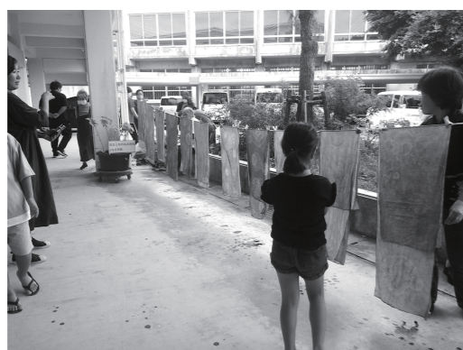
▲藍染め体験 ◀『綾道 -自然・植物編-』(R6.3月刊行)