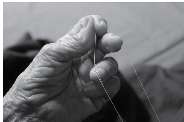
▲芋麻を細かく裂いて糸にしてい

や沖縄島とは異なる南の地域との関連の強い文化が宮古島で形成されていたことが分かっています。なお、宮古島の浦底遺跡からは、シャコガイ製の斧が二〇〇本以上出土しており、その数は世界最多の数となっています。