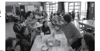
▼通いの場交流会の様子

「介護予防」や「閉じこもり予防」などの目的で、集会所や公民館などを利用し地域の住民が運営する「集う場」をいいます。それぞれの地域で工夫した内容で活動している場所と、重りを使った筋力運動（いきいき百才体操）を実施している場所があります。（現在の実施場所：33カ所）