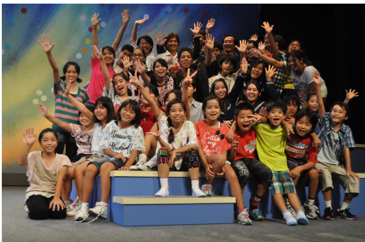
宮古島市子ども劇団立ち上げ公演