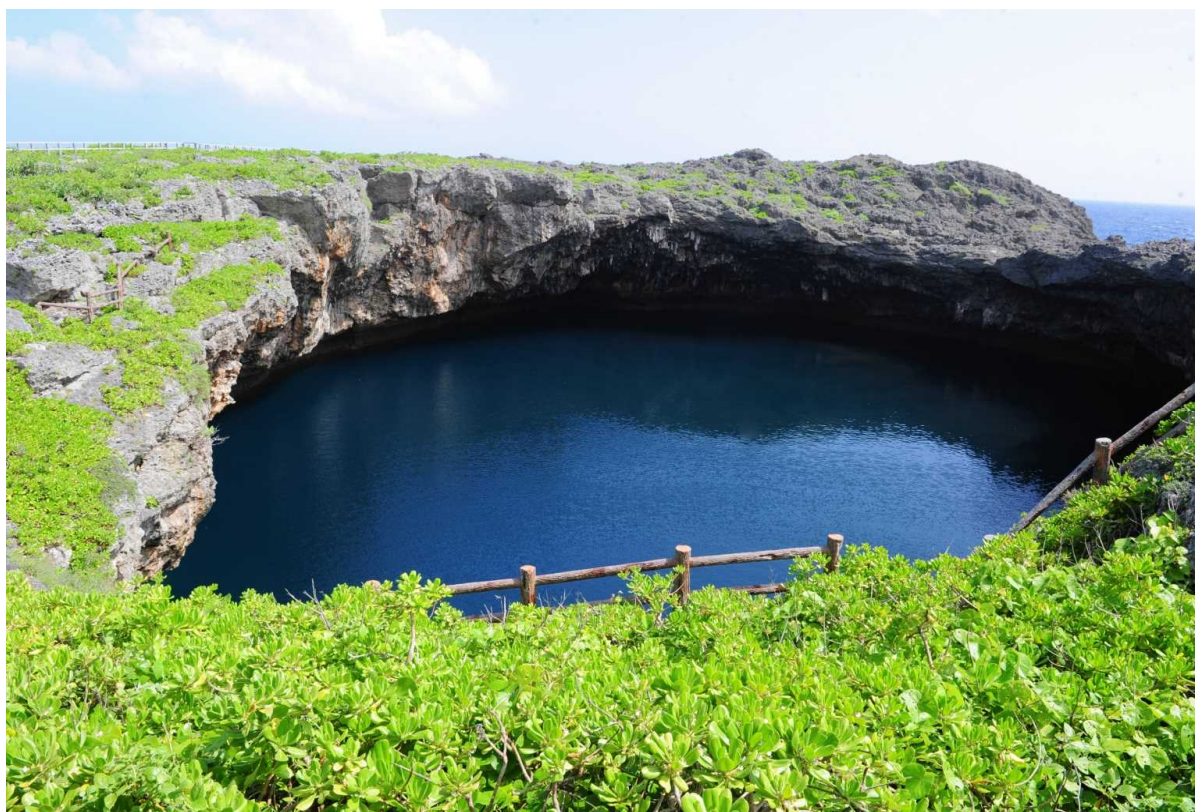
国指定名勝地・天然記念物 下地島の通り池（平成18年指定）